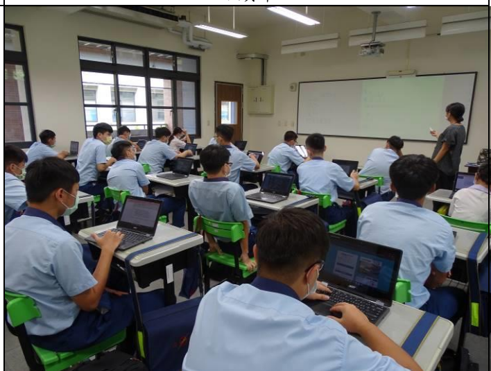
老師講解合宜的人際距離