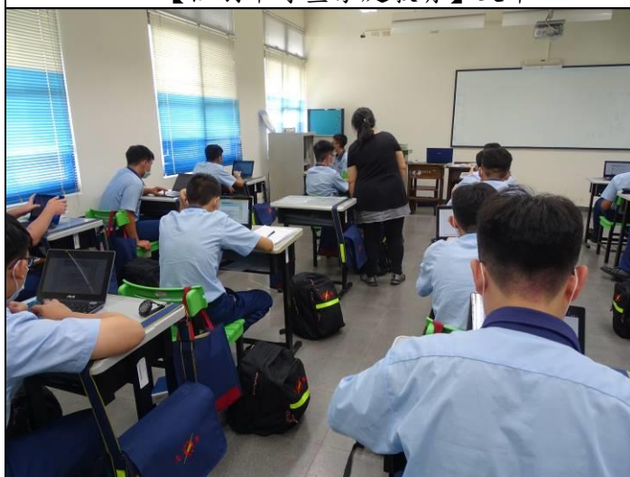
學生提問【性別平等暨家庭教育】 回饋單問題