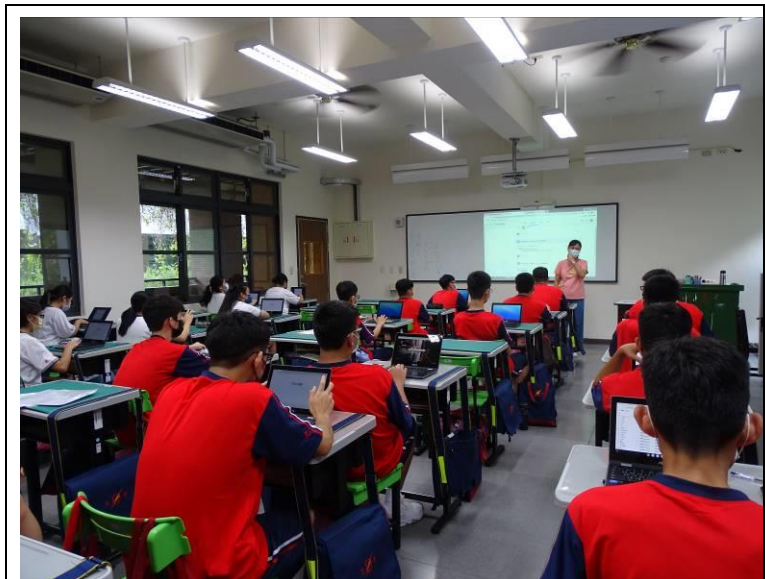
老師講解【性別平等暨家庭教育】 宣導流程