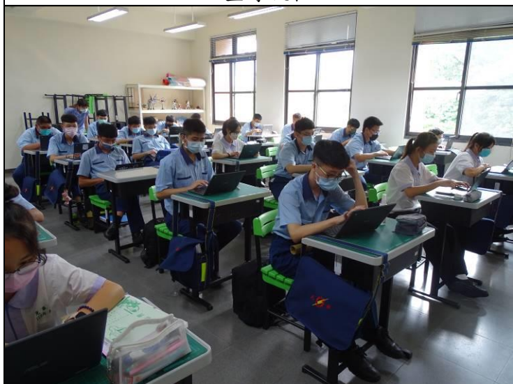
學生認真到線上閱讀 【性別平等暨家庭教育】文章