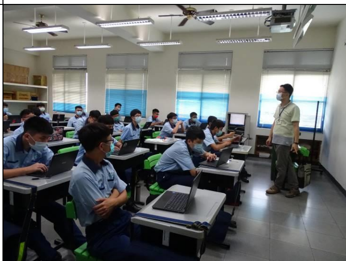
老師講解「五不四要」防護守則