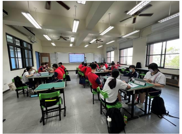
學生至google表單進行測驗後，導師藉由班級答題情形，帶領同學進行觀念澄清及討論。