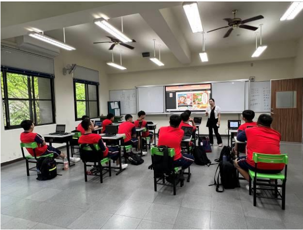
導師利用教育部性別平等教育全球資訊網-高中版漫畫海報，講解網路使用安全及注意事項。