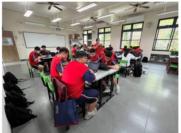
導師引導學生觀看青春發言人及法律宣導影片。