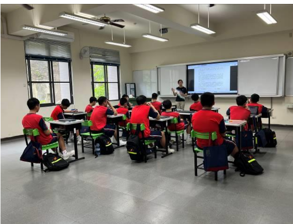
導師講解人際溝通中「理性表達」的方式，並請同學省思平時溝通方式。