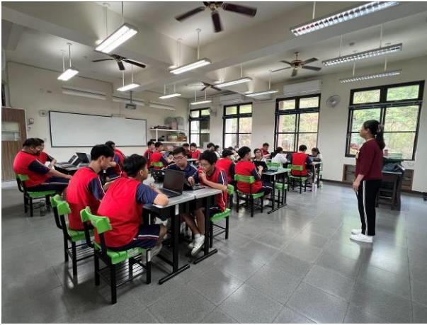
導師講解輔導專題引言，讓學生瞭解本次主題為網路使用安全及人際溝通練習。