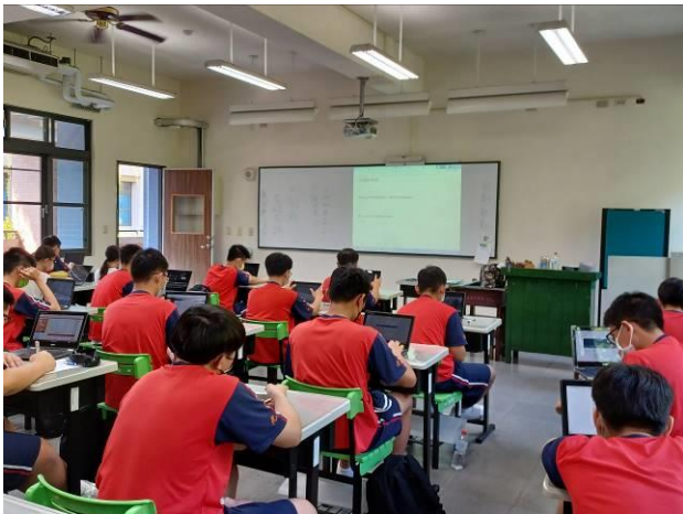
學生認真閱讀量表的各項說明，回顧三年來的學習狀況後作答。