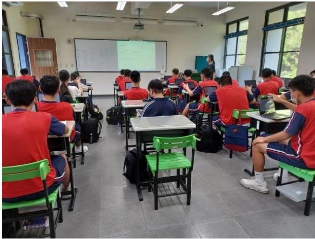
導師講解回顧與展望的活動目的。