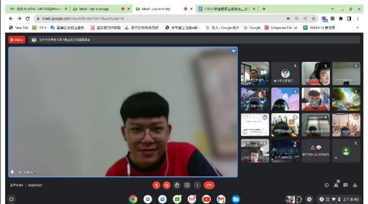
學生感謝師長三年來的教誨，及同學在學習、生活上彼此的協助。