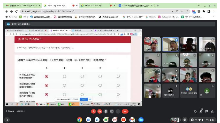
學生分享在師長教導下，這三年來無論是在品格、學業和行動學習能力方面都能依照師長指導完成。