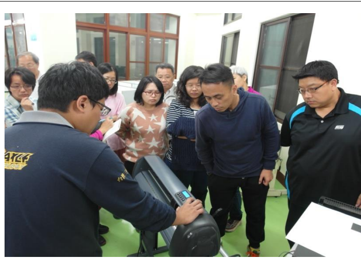
電腦割字機操作說明