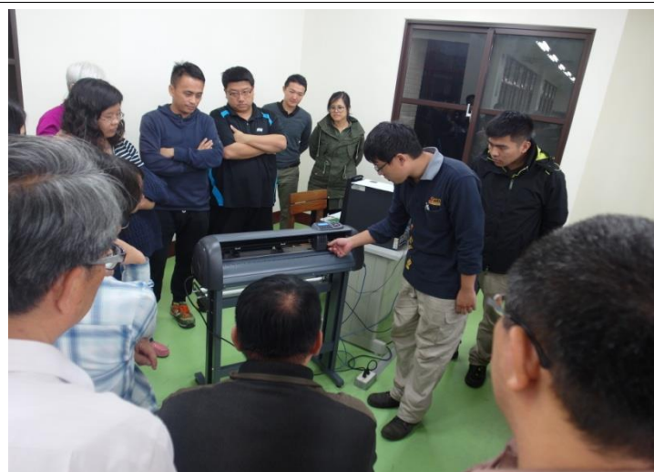
電腦割字機操作介紹