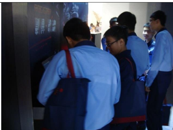
用心體驗展示主題。