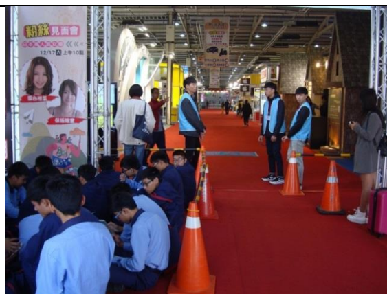
有秩序排隊等候進場，並預習參觀重點。