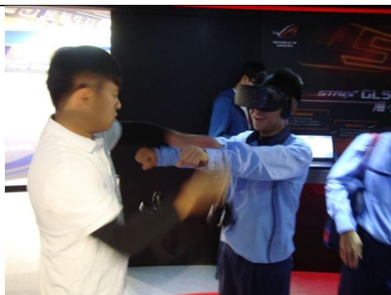
開心體驗展示主題。