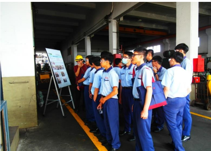
機械二孝學生參觀各機具