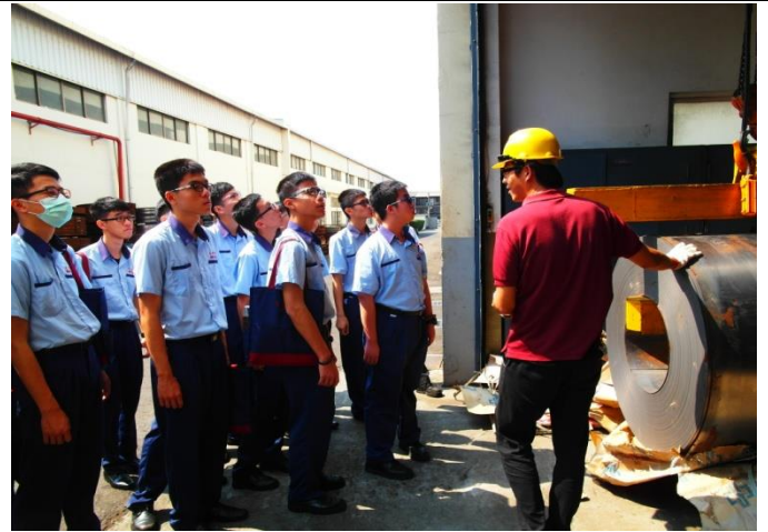
機械二孝學生參觀各機具