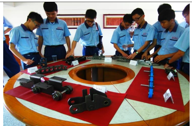
機械二孝學生認真研究機件