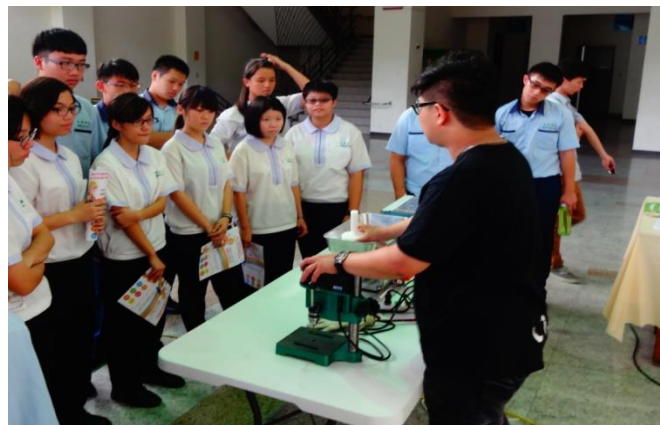
製圖三忠參觀機械夾捲危害預防