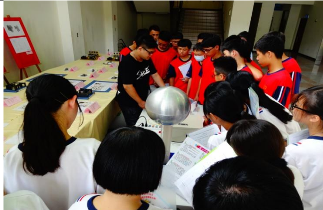
室設一孝感電危害預防體驗與作業環境監測工具介紹