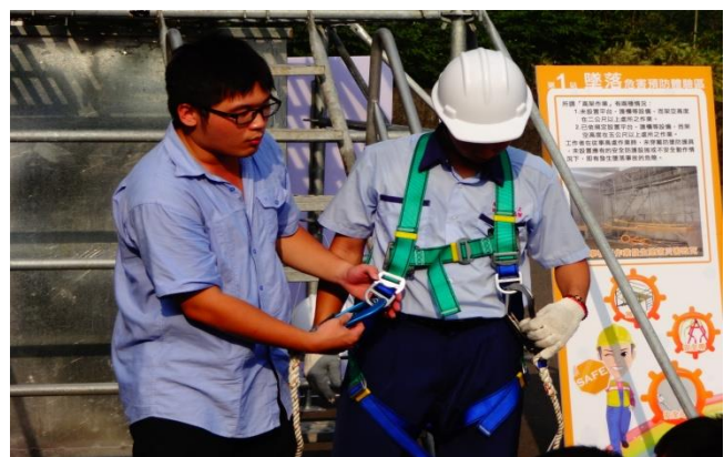
資訊二仁安全措施檢查