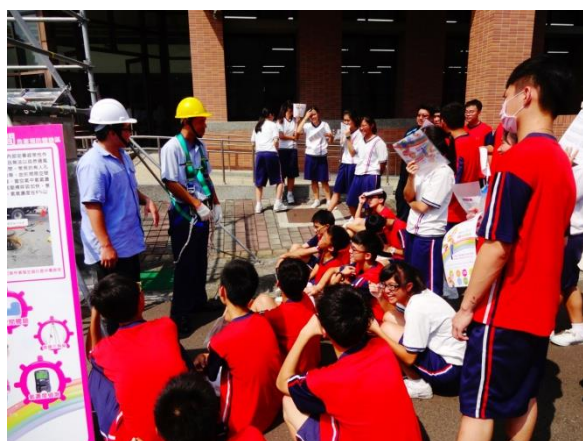
室設三忠體驗侷限空間危害預防