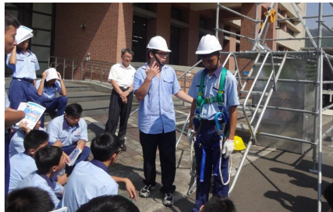
電機一忠體驗墜落危害預防