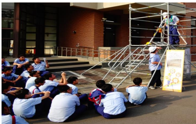
資訊二仁體驗墜落危害預防