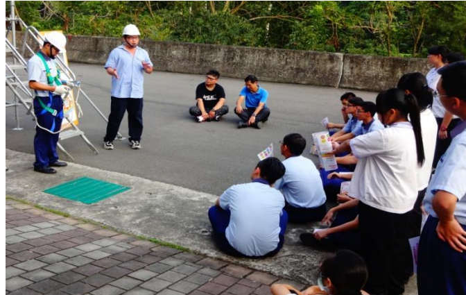
製圖三忠體驗墜落危害預防前，安全措施介紹