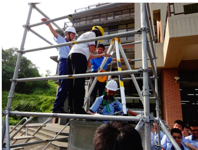
機械一忠學生體驗侷限空間危害預防，並實際操作