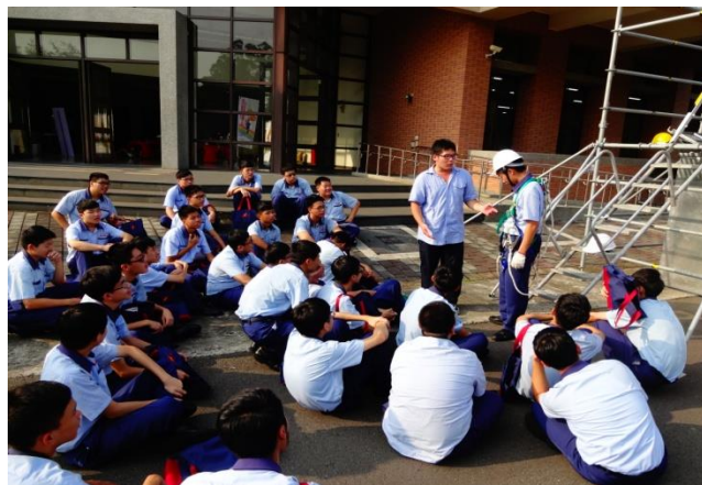
資訊二仁體驗墜落危害預防前，安全措施介紹