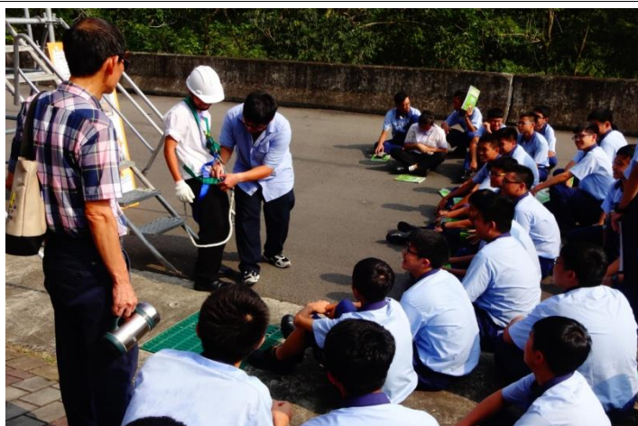
機械一忠體驗墜落危害預防