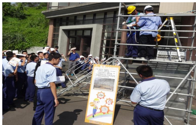
模具二忠體驗墜落危害預防