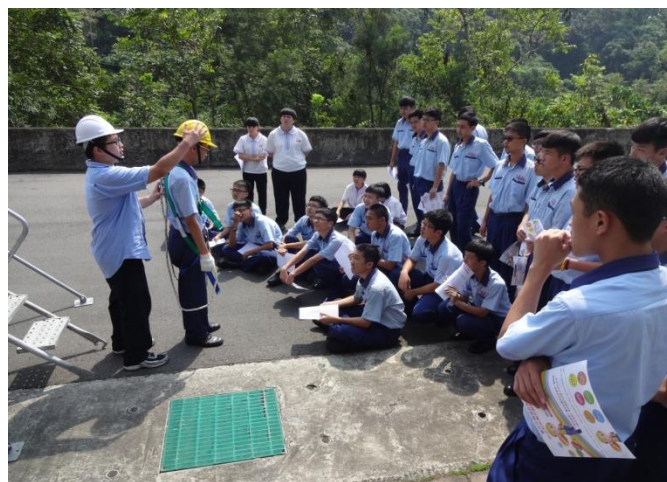
資訊二忠體驗墜落危害預防前，安全措施介紹