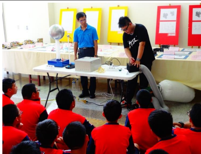
消防二孝觀摩作業環境監測工具介紹與感電危害預防