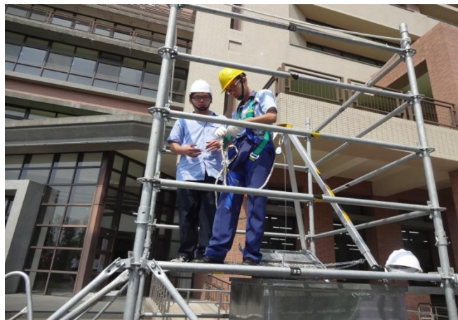
資訊二忠體驗墜落危害預防