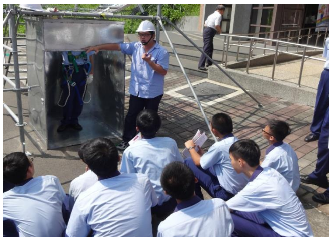
資訊二忠體驗侷限空間危害預防