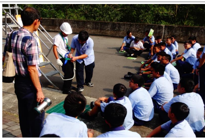
機械一忠體驗墜落危害預防