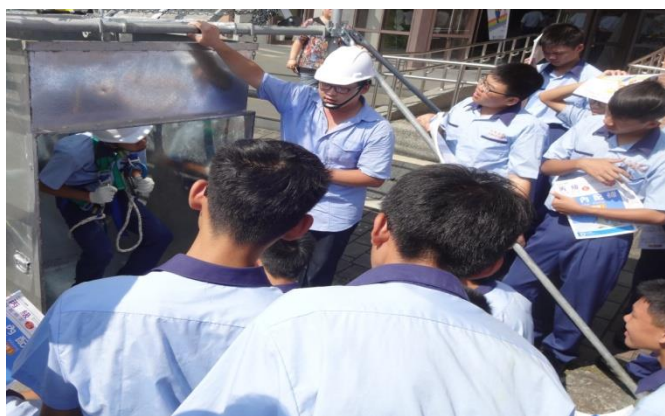
電機一忠體驗侷限空間危害預防