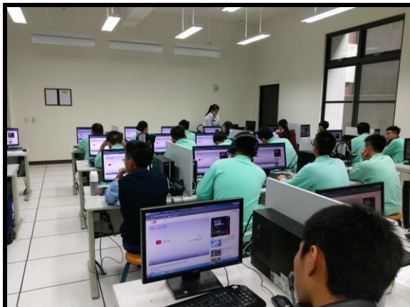
照片說明:介紹感恩節由來