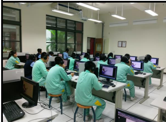
照片說明:觀看 voicetube 影片