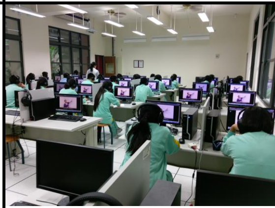
照片說明:觀看 voicetube 影片