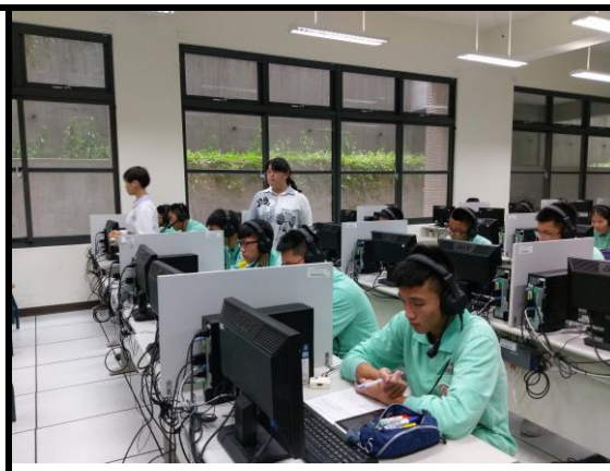
照片說明:說明主題活動內容