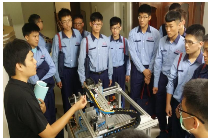
業界代表介紹機電整合儀器