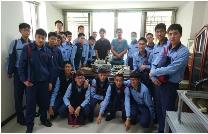
電機二忠於中教公司合影