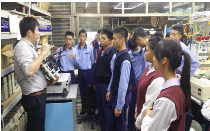
業界代表介紹伺服控制器運用