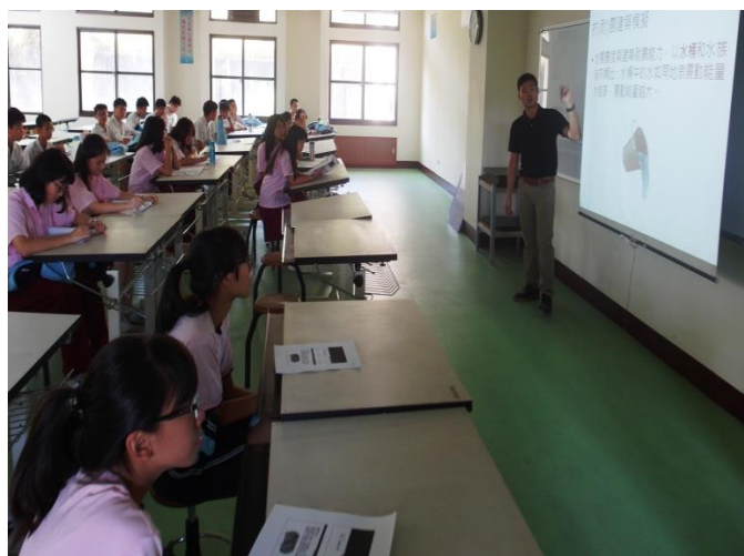
何厚緯老師講解抗震建築原理