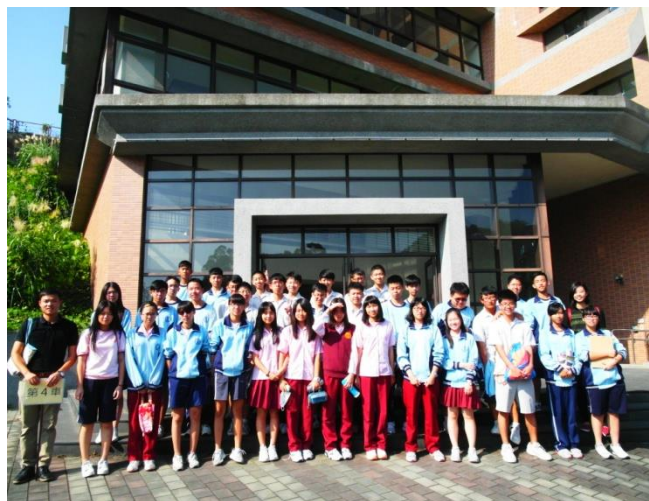
崇德國中師生於實習大樓前合影