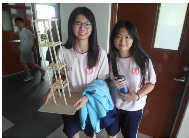
學生開心完成建築物模型作品