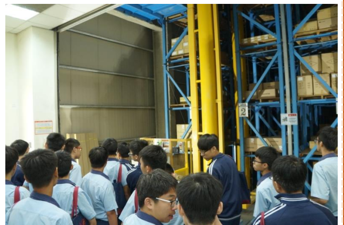
資訊二忠學生參觀自動倉儲