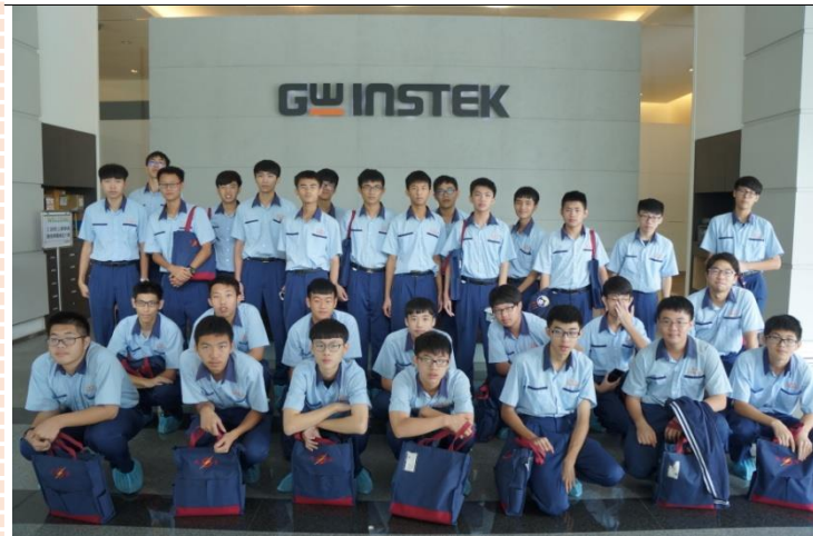
資訊二忠於固緯電子公司前合影