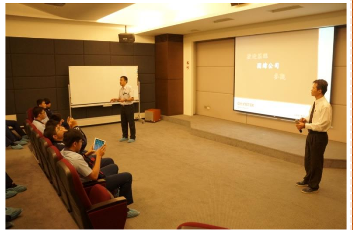
資訊二忠學生認真聆聽公司簡介