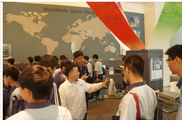
業界代表介紹公司產品