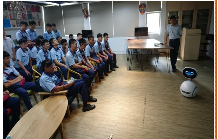
解說人員介紹會動的機器人