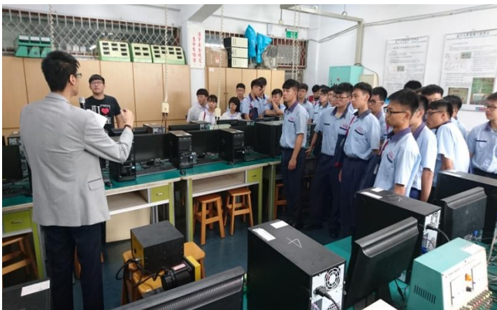
參觀介紹光電實驗室