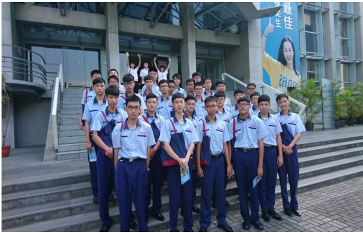
資訊三忠學生於逢甲大學資電學院合影