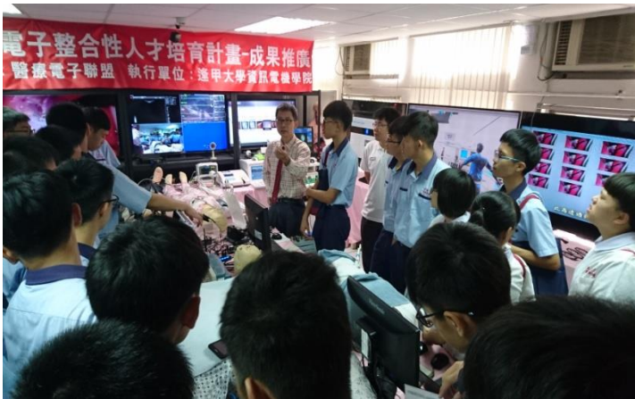
參觀介紹電子系 VR 生醫實驗室