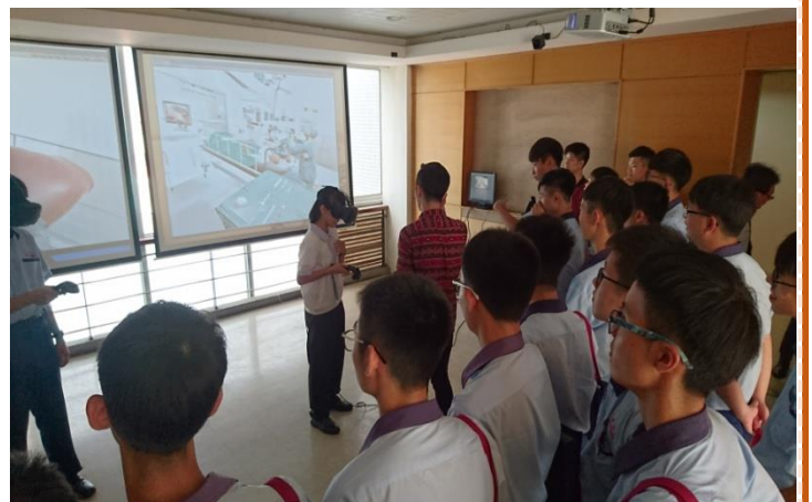
資訊三忠學生踴躍參與活動