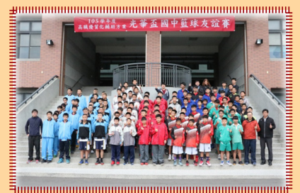
開幕後參賽隊伍大合照

105年12月17日辦理105學年度高職優質化輔助方案辦理光華盃國中籃球友誼賽，本次邀請臺中市四育、光正、太平、光明、成功、清水、外埔、神岡、育英、雙十、五權、崇倫及日南國中等13校籃球隊選手蒞校參賽，計189位選手報名參加，並由本校籃球隊隊員擔當賽務人員。在學務主任主持開幕儀式後，揭開比賽序幕，過程雙方你來我往，發揮平時練習所學，積極爭取比賽勝利，也展現運動家精神。比賽結果由崇倫國中拿下本賽事冠軍，亞軍為外埔國中，季軍則為日南國中。在中午的交流餐會中，各校教練除了藉此交換帶隊心得，球員間亦培養校際情誼，並相約明年見。