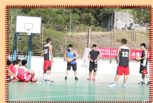
教練介紹「傳球練習」要點