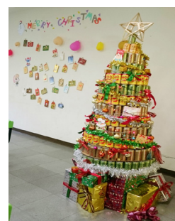
一年級第三名 - 室設一忠