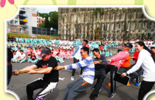
師生拔河，充滿歡樂