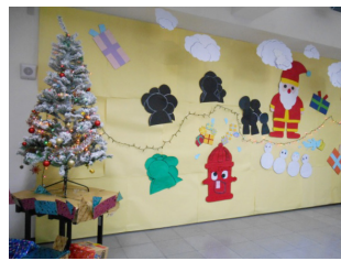
二年級第三名 - 消防二忠