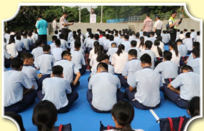
自治幹部研習開訓典禮

時間來到105年8月29日的「開學典禮」，隨著校車緩緩駛入校園，展開了新學期新的旅程，開學典禮上校長期勉所有同學能夠與我們的師長一起進步，師長們在暑假期間參加了很多的研習及會議，希望在新的學期中能夠給予同學們不同的學習方式。在新的學期中，我們接受三位國際的交換生，期望在與他們的互動之下，皆能有所成長及收穫。