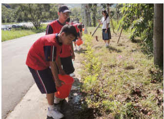
動手做做看綠籬種植