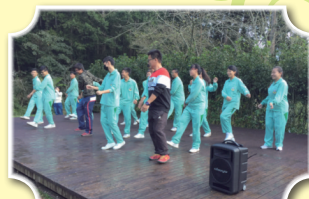
早晨的原住民舞蹈，熱力四射～