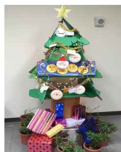
一年級第二名 - 動畫一忠