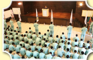
結訓典禮，充滿感動與感恩