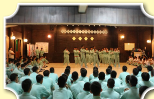
各班使出渾身之力展現班級特色