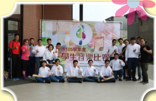
壯闊的太鼓，震撼全場

105學年度，本校管樂隊、儀隊受邀擔任各項慶典及開幕活動表演，如「台中市遙祭黃陵春、秋祭國殤」；「友善國際勞工嘉年華活動」踩街活動；梧棲國中、太平國小以及東新國中的校慶開場表演；「我愛水資源宣導暨山城區全民運動大會」與「台中市105年度全民瘋鐵馬健行活動」的開幕表演等活動，凸顯本校樂儀隊的整齊劃一、精神煥發的活力。