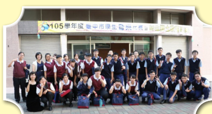
悠揚的合音展現合唱團的實力