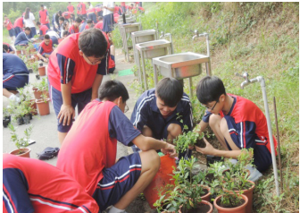
親身體驗種植的樂趣

本校推行勞作教育活動多年，相關內容多元化，自本學年度暑假開始，已進行「教室粉刷」讓每天生活在教室內同學有一個清新的學習環境。提高學習效率，並從做中學習到油漆粉刷之技能，對於居住之環境整理有著正向之助益。「物品整理」活動教導同學對於物流之管理概念在眾多科目書的書籍、簿本中思考如何進行分類放置，精確的數量確認，有系統的正確地物品發放，學習到迅速、正確地將書書籍、簿本發放到同學。「園藝養護」，第一次活動，校園內之樹木認識及種植對環境的助益，校園植栽施肥作業，第二次活動，盆栽內金露花、六月雪樹苗種植至RB道路旁施作，第三次活動，將錫蘭葉、平戶杜鵑、野牡丹及蔓性馬纓丹等花苗種植盆栽內，並帶回教室養護等，可使同學學會樹木種植及養護等技能。