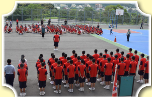
雄壯威武的軍歌比賽

105年9月27~29日於日月潭青年活動中心辦理高一新生營活動，因「梅姬」颱風攪局，故更動於學校分二階段舉行，但是同學們的熱情依然不變，10月13日高一各班高喊著班歌及班呼，精神抖擻展開序幕。校長主持開訓典禮後，首先登場的是「綻放光華」，由學務處三位組長串場演出和家人溝通時常遇到的困境，並藉由輔導老師的說明讓同學們瞭解和家人的溝通技巧；緊接的是「軍歌比賽」，整齊的步伐、慷慨激揚的軍歌聲，迴盪在整個操場；下午的「拔河比賽」，上場同學賣力爭取榮耀、場邊同學盡力加油，現場畫面皆展現班級的團結一致。時間到了11月25日，同學滿心期待的「光華百分百(原光華之夜)」終於上場，每個班級均展現了精彩的團舞，這樣的氛圍也感染台下的班級，同學們的身體也隨著音樂的節奏律動，大家皆享受著這場比賽帶來的感動。結訓典禮上，主秘期許同學們「要學會說話的藝術，因為說話層次與內容就代表你這個人，所以應該要互相尊重，說合理的話、有禮貌的話，應該說合於對方身分的話，然後別人就會尊重你的為人。在你的未來生涯上，不會有正確答案，你們必須有不同的成長與付出。如果你們能按部就班的處理事情這樣是很好的，但如果你們要在按部就班之外獲得更好的事要靠自己的努力成長，因為老師不會陪伴你一輩子，父母也不會，你們終究要自己面對未來，放下幼稚的心態，才能成熟面對事情。」