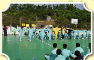
光華百分百，舞動青春