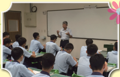
主任指導自治幹部研習

期許各班的幹部能夠有所成長，在105年8月26日辦理「班級自治幹部研習」，目的在於培養各班的中堅份子並在「領導中學習、學習中領導」的認知，擴展視野和提升同學間的溝通能力，進而成為值得師長與同學信賴的領導人才，對於社會有所貢獻。