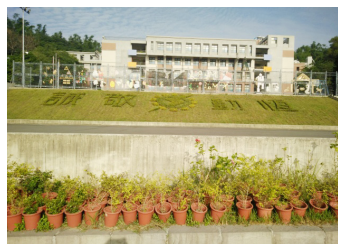
新種植之校訓暨校徽