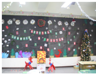
二年級第二名 - 室設二忠