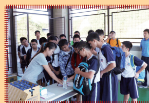
育英國中同學排隊報到