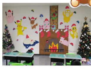
三年級第三名 - 室設三忠