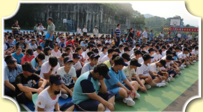
開訓集合，同學們準備就緒

國中學程的結束，不僅是一個階段的結束，也是另一個新的開始，在充滿祝福的這一刻，「光華新鮮人始業輔導」於105年8月23、24及25日熱烈展開，主要希望每一位加入光華大家庭的新生們可以更加瞭解學校的環境、作息與調整自己的步伐。藉以各處室業務說明、各科簡介、校園巡禮、防震防災演練、健康檢查、校歌教唱、班旗、班歌、班呼設計等活動，期能幫助每一位新生能更快投入校園生活、堅定向學意念，成為堂堂正正的光華新鮮人。