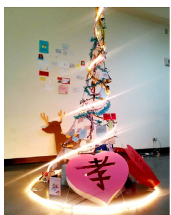
一年級第一名 - 室設一孝