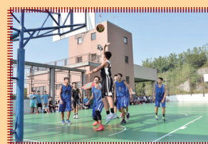
分組循環賽，育英國中 VS. 崇倫國中