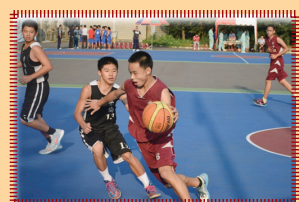
冠軍賽，崇倫國中 VS. 外埔國中