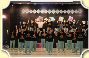
晚會表演，各班熱情演出！！

105年10月25、26、27日於溪頭辦理高三公訓，開場的「軍威軍容大闖關」使得同學為這次的公訓上緊發條，緊接著「體能競賽」讓同學體會團結共同完成的快樂與分享在一起的時光。晚餐後，同學平時練習許久的「光華之夜」如火如荼地展開，現場的氣氛隨著同學們的鼓舞渲染開來，除了同學們的勁舞之外，本次多位老師也帶來充滿歡樂的SOLO，精彩連連，好不熱絡！！收尾的「光華夜話」伴隨涼涼的晚風，老師和同學一同分享彼此的原諒與祝福之下進入了夢鄉。「貴重器皿」，以愛情起頭，使得同學了解愛情與親情都需要灌溉與培養，並且為這兩天精彩的公訓活動畫下一圓滿的句點。