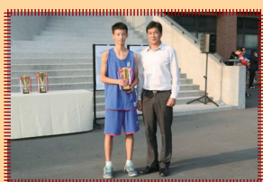
頒獎，亞軍日南國中