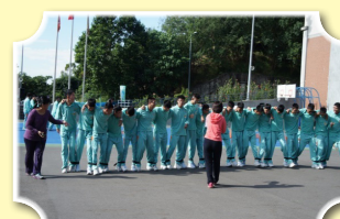
校慶20人21腳比賽，趣味橫生