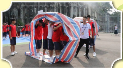
時代巨輪，轉動新生們的世界

期許各班的幹部能夠有所成長，在105年8月26日辦理「班級自治幹部研習」，目的在於培養各班的中堅份子並在「領導中學習、學習中領導」的認知，擴展視野和提升同學間的溝通能力，進而成為值得師長與同學信賴的領導人才，對於社會有所貢獻。