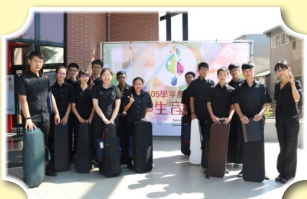
弦樂團大合奏，弦音飄揚

「太鼓隊」、「合唱團」以及第一次報名的「弦樂團」參加臺中市學生音樂比賽暨師生鄉土歌謠比賽，各團隊在本次比賽皆獲得不錯的成績，並且代表臺中市參加106年全國學生音樂比賽決賽，太鼓隊獲得「優勝」、弦樂四重奏獲得「甲等」佳績。