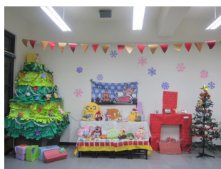
三年級第二名 - 動畫三忠