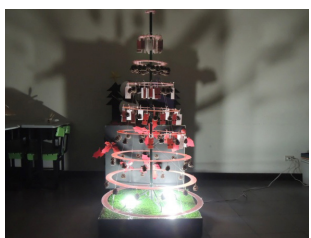
三年級第一名 - 動畫三孝