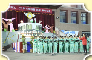
合唱團帶來感性的耶誕歌曲

12月3日校慶活動在「樂儀隊」及「太鼓隊」的開場下熱烈展開，高三的公訓優勝的班級帶來精彩的團舞表演使得現場熱鬧不斷。比賽的鐘聲一敲，同學們等待已久的體能趣味競賽開始了，高一的「20人21腳」、高二的「趣味大隊接力」以及高三的「拔河競賽」，在校園各處如火如荼的展開，現場歡笑聲、加油聲不絕於耳。最後的頒獎典禮，同學們也給予得獎的班級熱烈的掌聲中，結束精彩的校慶活動。