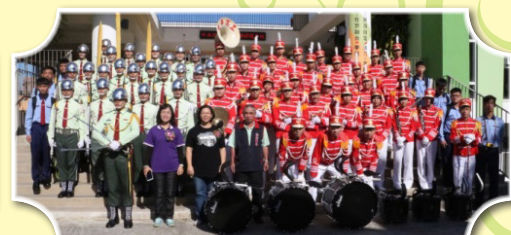
樂儀隊參加校慶表演，增添風采