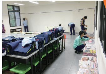
同學們分工合作美化教室