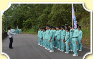
闖關進站，精神喊話