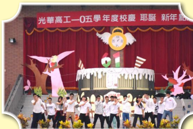
高三舞林高手，熱鬧整個校慶

光華61週年的校慶、耶誕點燈活動在一連串的布置之下展開了它的奇幻之旅，旅程的開始，由童軍社為我們製作精神堡壘、室設與動畫連袂佈置教學大樓，讓學校過節及校慶的氣氛提升許多；12月2日點燈活動邀請高一新生活動的團舞表演，為本次的活動暖身；接著由高三各班共計23名「舞林高手」同台演出，同學們的掌聲及歡呼聲響徹雲霄，隨後「儀隊特技槍」的精心特技，讓現場同學的驚呼聲不斷；表演活動結束，恭請校長主持點燈儀式—「五、四、三、二、一，點燈」校園角落燈亮的那一刻，串起光華人的感動與記憶，並封存在真心的祝福裡，合唱團也為我們帶來「奇異恩典」及「這一生最美的祝福」為此時此刻的心情帶來溫暖。