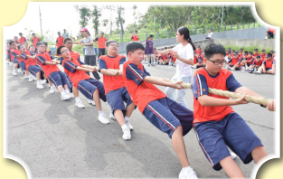
高一拔河比賽，全力以赴