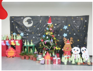
二年級第一名 - 動畫二忠