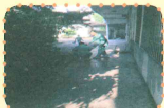
▲校友回娘家迎賓準備。