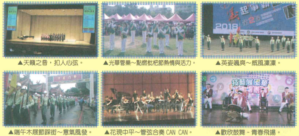
▲天籟之音，扣人心弦。

106學年度，本校「管樂隊」、「儀隊」受邀擔任各項慶典、開幕活動表演暨參加競賽，如臺中市「遙祭黃陵春祭國殤」、「太平枇杷節」、「端午木屐節踩街」表演、「第二屆全國高中儀隊競賽」；精湛的槍法與活潑多元的曲風，受到與會各界人士的讚賞與好評。「太鼓隊」參加臺中市高中職教育暨國中技藝教育博覽會以震撼人心的鼓藝展現光華社團多元學習的精神。「弦樂團」與「管樂隊」聯袂參加臺中市平國中「2018年度音樂會-花現中平」，精彩的演奏技巧及絕佳默契，獲得現場嘉賓的喝采！「太鼓隊」、「合唱團」代表臺中市參加106學年度全國學生音樂暨師生鄉土歌謠比賽決賽。各團隊在比賽中皆獲得優異的成績。「太鼓隊」獲得打擊樂合奏「優等」，合唱團獲得混聲合唱、福佬語系高中職團體組「甲等」佳績。另「太鼓隊」至高雄參加「2018年第六屆全國鼓陣大賽」，富藝術性的擊鼓技巧，氣勢磅礴，榮獲太鼓錦標賽第二名，驚艷南臺灣！