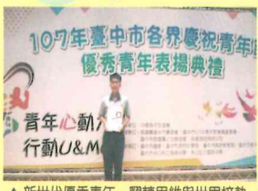
▲新世代優秀青年~翻轉思維與世界接軌。