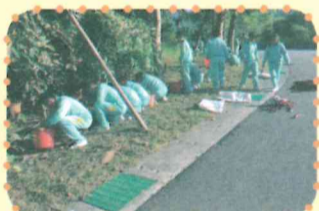
▲認識一草一木細心呵護。