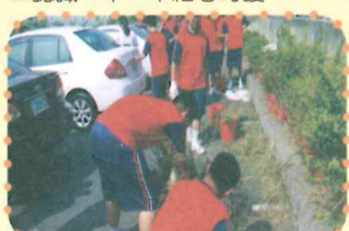
▲除草施肥沃土行動。