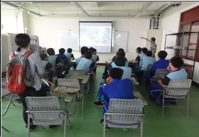
同學認真聆聽老師講解