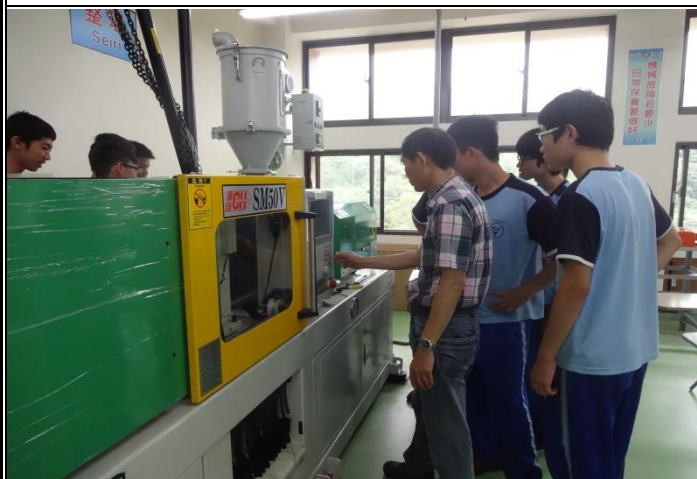
老師解說機具相關構造