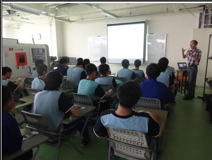
老師說明課程相關知識