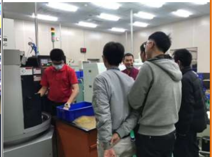
光華高工畢業學生任職產業之機械操作人員