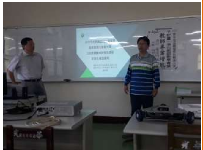
群主任介紹此次研習的目的