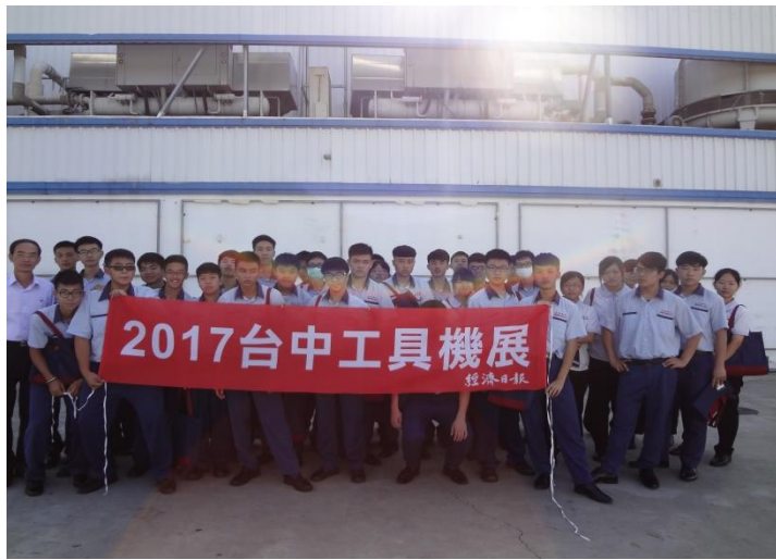
製圖三考學生於台中工具機展合影