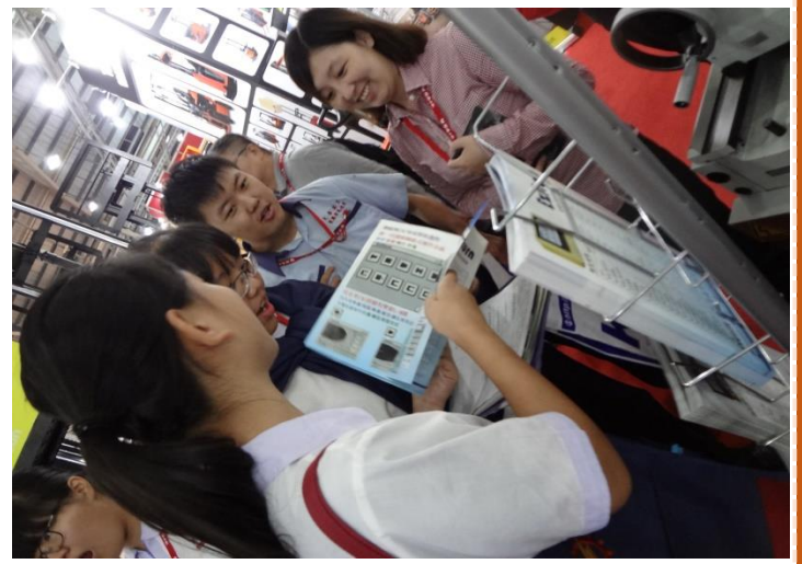
參觀產業機械區聆聽解說