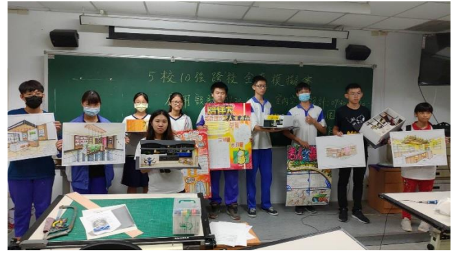
5 校 10 強友誼賽選手與作品合影