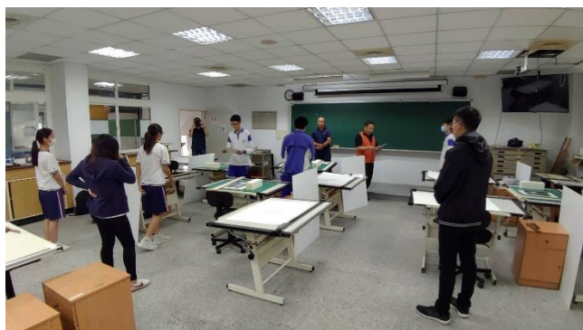
大湖農工教務主任在開場儀式勉勵各校選手