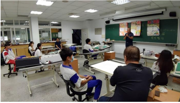
評審老師給予選手競賽的建議與期勉